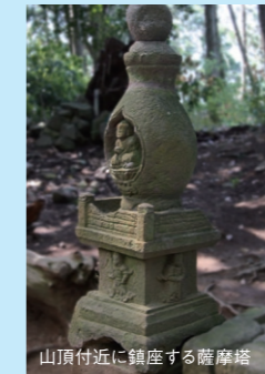
山頂付近に鎮座する薩摩塔

久原川の西側にそびえる山は、中世には首羅山とよばれ、350坊をもつ大きな山林寺院でした。平成17年度から調査を開始し、平成25年3月に国史跡に指定されました。 開山伝承によると、白山権現が百濟から虎に乗って降り立ち、乗り捨てられた虎の猛威に恐れれた村人が、その虎の首を切り捨てたところ、首が光ったそうです。そこで村人は虎の首に羅物(薄絹)をかけて十一面観音をまつたそうです。こうした伝承から「首羅山」という名がついたようです。 遺跡は山の北側にあり、遺跡面積約40ha、本谷地区・西谷地区・山王(日吉)地区・山頂地区に遺構が良好な状態で残っています。調査によって山の中核施設は本谷地区にあり、鎌倉時代には大規模な五間堂が作られたことがわかりました。西谷地区に