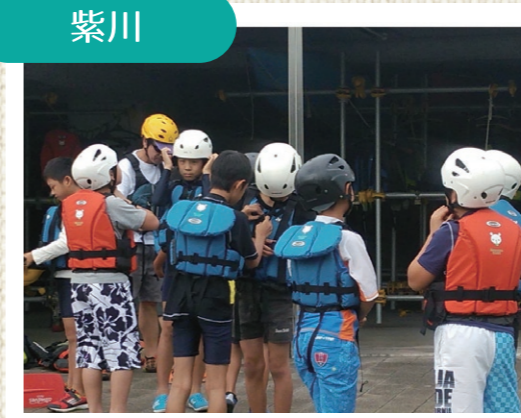
ライフジャケット着用の講習を受けています(紫川)