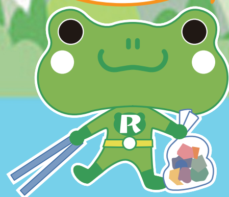
河川愛護事業 イメージキャラクター よみガエルくん