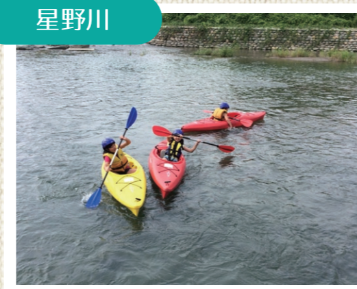
カヌーに乗りました(星野川)