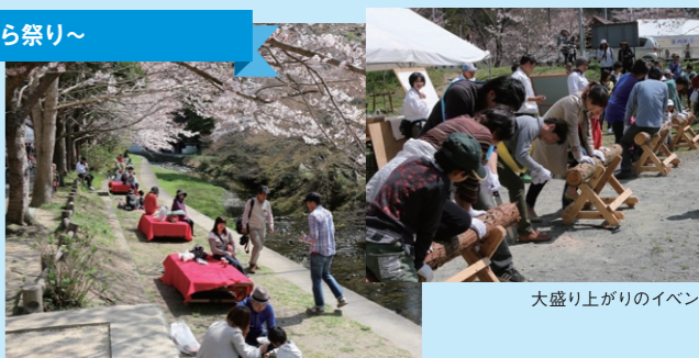
大盛り上がりのイベント

自然を満喫できるスポットとして、1年を通じてたくさんの人が訪れる猪野川沿いの天照皇大神宮と猪野公園。ここを舞台として、毎年3月末に開催されるお祭りです。久山産の商品やおいしい食べ物の出店、音楽演奏や作品展示、艶やかな夜桜のライトアップなど、普段は静かな山里である猪野が一転して賑やかなお祭り広場となります。またイベント会場では丸太切りや竹灯籠製作など、来場者を飽きさせない趣向を凝らしており、3回目にして多くのリピーターがいるほどです。