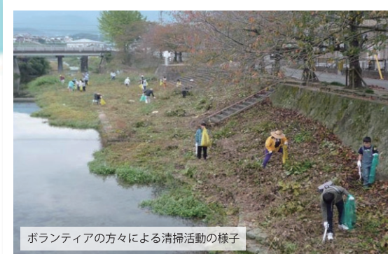
ボランティアの方々による清掃活動の様子