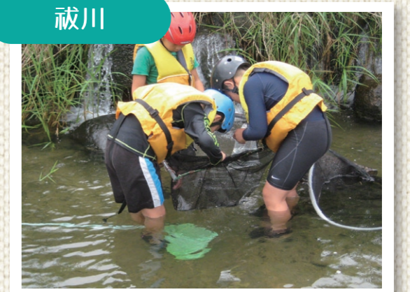
魚が捕れました!(祓川)