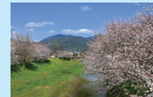
ゆるやかに流れる久原川。はるか遠くに見えるのは遠見岳。

など様々な生き物が自然を謳歌しています。 また自然とのふれあいを大切にしている久山町ではいずれの川にも緑道が通り、せせらぎに耳を傾けながら散策を楽しむことができます。また川岸も所々でなだらかに整備されており、大人から子どもまで気軽に川遊びができるようになっています。