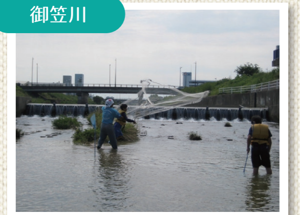
網を使って魚とり!(御笠川)