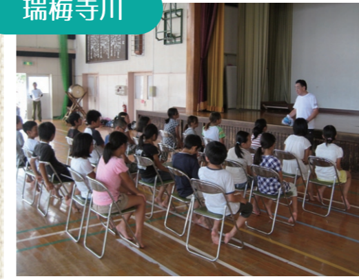
先生の話を熱心に聞く子どもたち(瑞梅寺川)