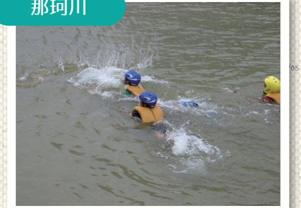
レスキューロープを体験しました(那珂川)