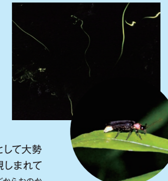
蛍の里 久山では、毎年初夏にたくさんの蛍が舞い飛びます。