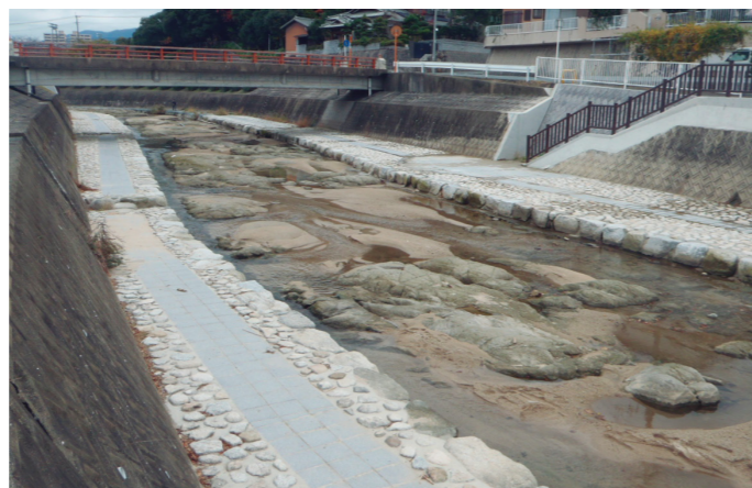
平成21、22年度施工箇所