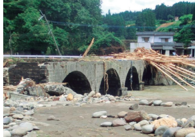
被災直後の宮ヶ原橋