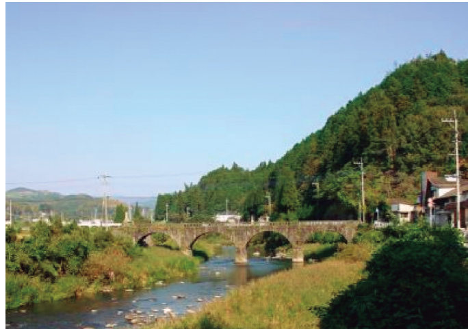
被災前の宮ヶ原橋